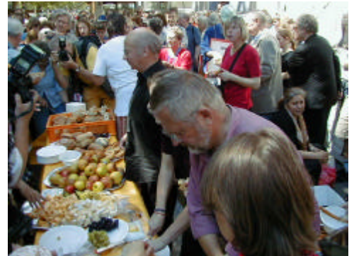
Bischof Gaillot beim Mahl der Solidarität

Ökumene ist mehr als gemeinsam eucharistisches Brot und Wein zu teilen. Deshalb wurden zu dem „Mahl der Solidarität“ auf dem Kurfürstendamm vor der Deutschen Bank, neben dem Hotel Kempinski, auch die eingeladen, die Not leiden. Das „Mahl der Solidarität“ wurde von Bischof Gaillot eröffnet und gemeinsam mit den „Ordensleuten für den Frieden“ gestaltet, die seit vielen Jahren Mahnwachen halten, um auf die immer größer werdende Kluft zwischen armen und reichen Völkern und ungerechte Finanzgebaren hinzuweisen.