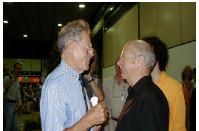
Prof. Dr. Hans Küng und Bischof Jacques Gaillot