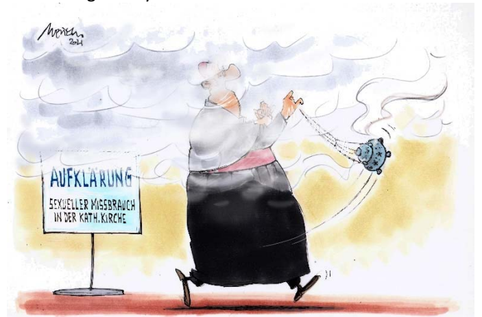
Aufklärung sexueller Missbrauch in der kath. Kirche

Die verworrene Situation im Erzbistum Köln stellt derzeit eine große Belastung für den Synodalen Weg dar. Der Vertrauensschaden, den das bisherige höchst widersprüchliche Verhalten von Kardinal Woelki innerhalb wie außerhalb der Kirche ausgelöst hat, ist immens. Die Kirchenaustrittszahlen sind dramatisch. Die Reaktionen von Diözesanrat und Priestern aus Köln und von verschiedenen deutschen Bischöfen zeigen, dass eine fruchtbare Pastoral im Erzbistum Köln derzeit unmöglich ist. Den Synodalen Weg hat Kardinal Woelki von Anfang an boykottiert und sabotiert.