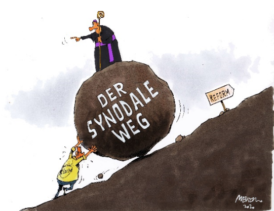
Karikatur: © Gerhard Mester

➤ Bitte beachten Sie auch den beiliegenden Prospekt des Herder-Verlages .