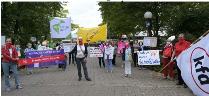
Wir sind Kirche Speyer bei der Aktion vor dem Ludwig-Pesch-Haus in Ludwigshafen

> www.wir-sind-kirche.de/?id=125&id_entry=8378