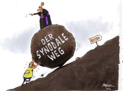
Karikatur: © Gerhard Mester

Schon jetzt findet der Synodale Weg auch international große Beachtung. Weltweit wird Hoffnung darauf gesetzt, dass auf die Krisen der Gegenwart pastoral verantwortliche und theologisch fundierte Antworten gefunden werden. Dazu braucht es aber ein breites Bündnis der Reformkräfte, auch in der Bischofskonferenz. Nach Einschätzung von Beteiligten beträgt das Verhältnis von Reform*innen zu Strukturkonservativen beim Synodalen Weg 90 zu 10 Prozent; bei den Bischöfen etwa 80 zu 20 Prozent.