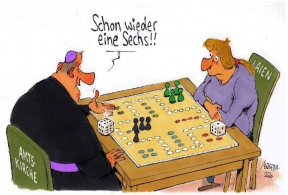
Karikatur: © Gerhard Mester

> www.wir-sind-kirche.de/?id=125&id_entry=8378#VODERHOLZER