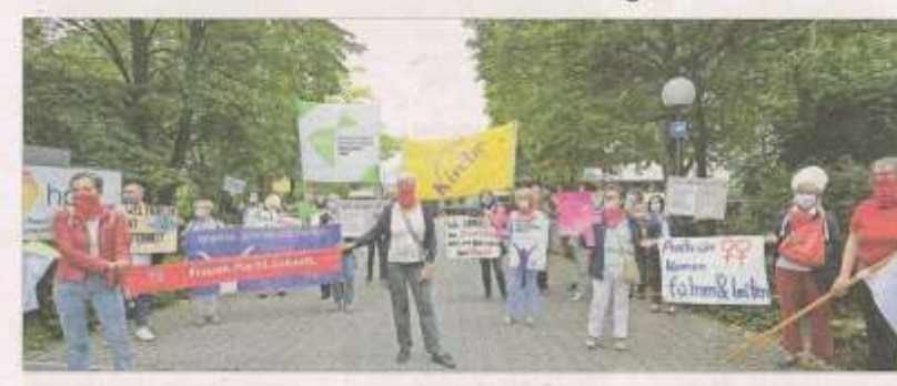
Im Einfahrtsbereich des Heirrich Pesch Hauses vollten die Teilnehmenden der Mahnwache ihre Plakate aus.

Sie hatten sich am Morgen zu einer Mahnwache in der Einfahrt des Heinrich Pesch Hauses postiert, organisiert von den beiden Frauenverbänden im Bistum, Katholische Frauengemeinschaft Deutschlands (kfd) und Katholischer Deutscher Frauenbund (KDFB). Anlass war die Regionenkonferenz des Synodalen Weges, die an diesem Tag im Pesch-Haus tagte. Unter die Demonstrierenden hatten sich neben Vertreterinnen der Frauenverbänden auch diözesane Mitglieder der Katholischen Arbeitnehmer Bewegung, des Kolpingwerks, des Bundes der Deutschen Katholischen Jugend und der