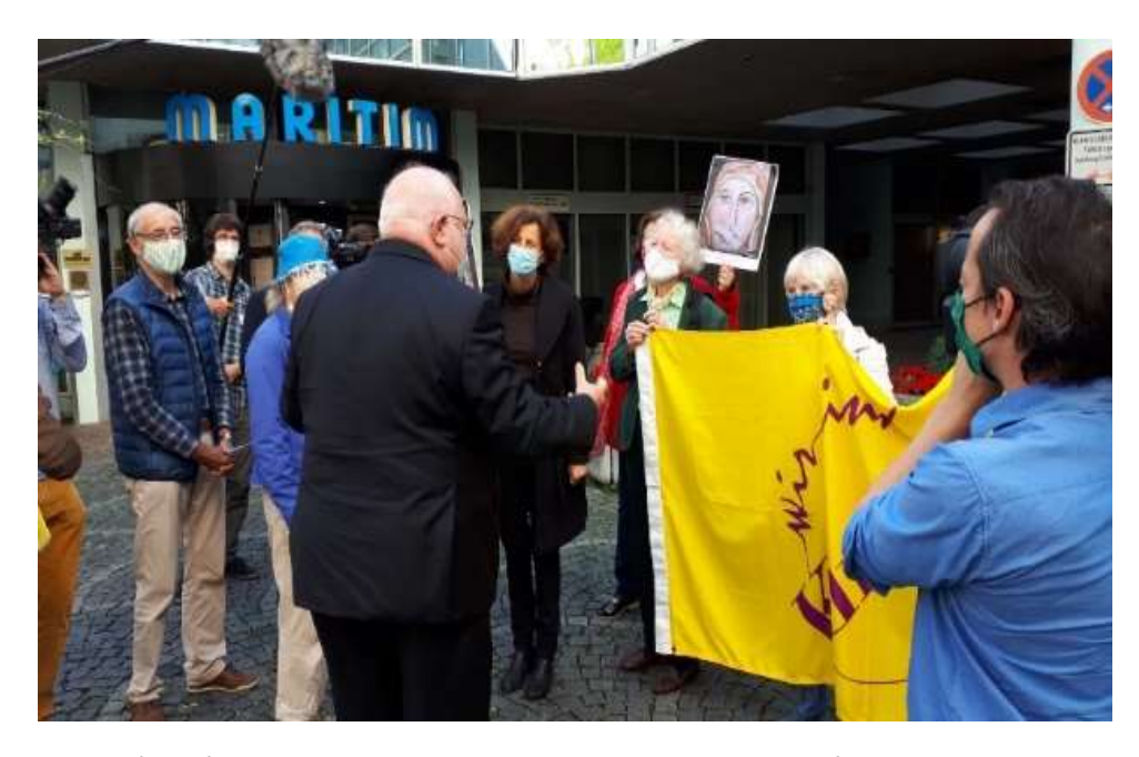
Cardinal Marx meets protesters in Munich