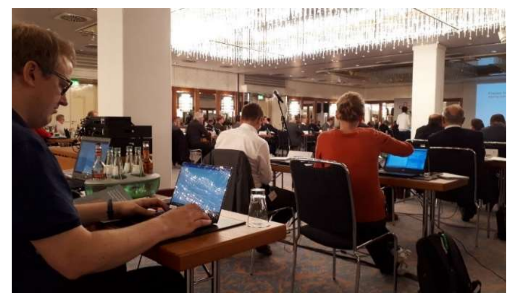
Regional meeting in Munich All meetings were open to the press.