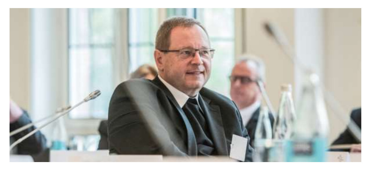
"I consider the diaconate of women very legitimate"