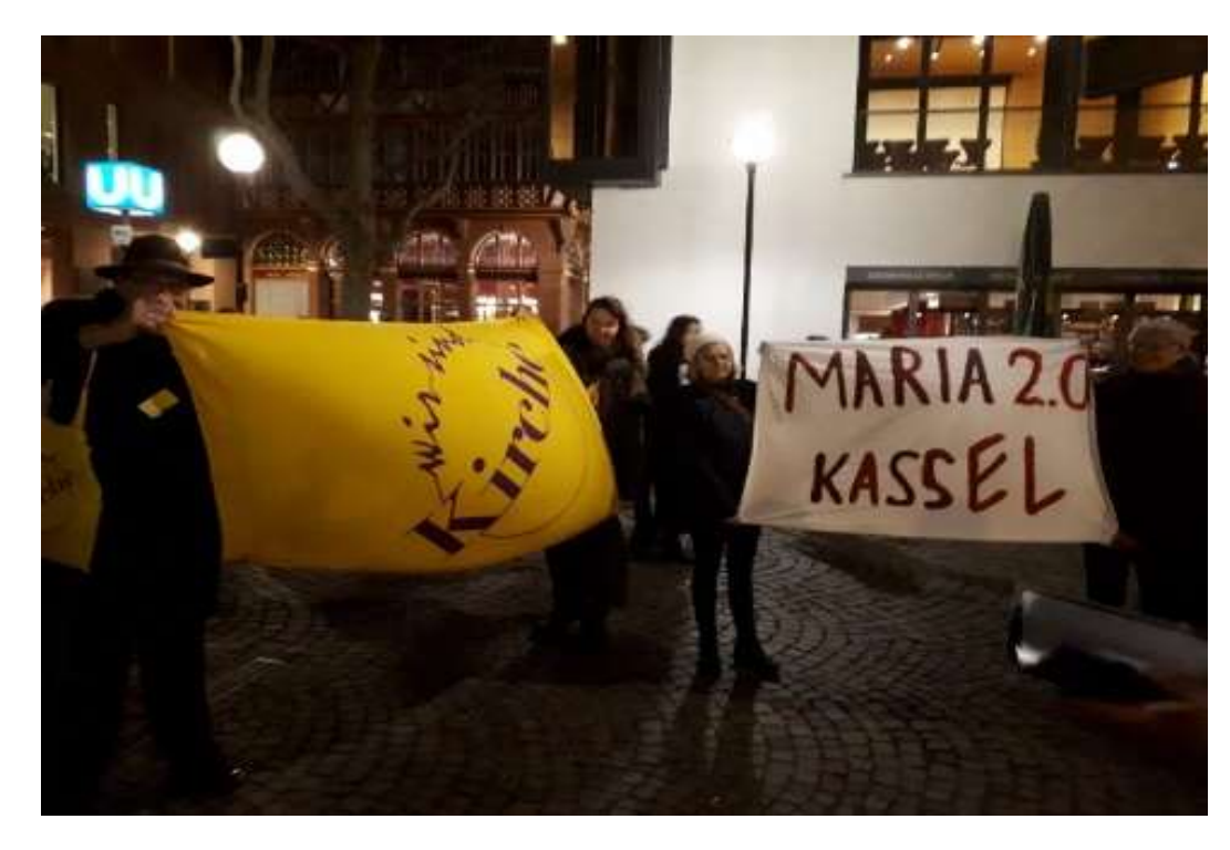
Protests and vigils all nicht long by Maria 2.0 , We Are Church and Catholic Women Organisations