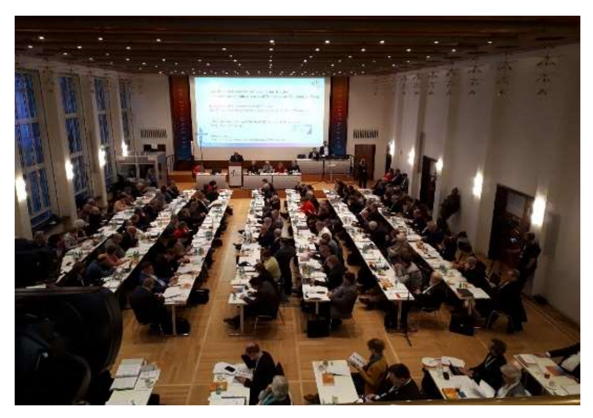
Clergy and lay sitting side by side in alphabetical order

All women standing together, but they are still a minority