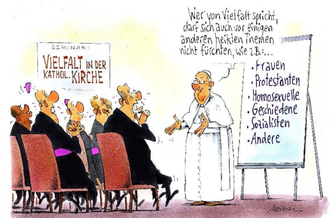
Wer von Vielfalt spricht, darf sich auch vor einigen anderen heiklen Themen nicht fürchten, wie z.B.:... . Karikatur: © Gerhard Mester

→ www.wir-sind-kirche.de/?id=125&id_entry=7409