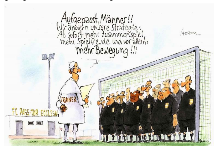
Aufgepasst, Männer!! Wir ändern unsere Strategie: Ab sofort mehr Zusammenspiel, mehr Spielfreude und vor allem: mehr Bewegung!!!

lischen Kirche werden von traditionalistischen Gruppen aber schwere Geschütze sogar direkt gegen Franziskus aufgeföhren, um die klerikalen Bastionen zu verteidigen und jegliche Reformdebatte zu verhindern (z.B. Kardinal Müllers „Glaubensmanifest“). Doch das darf nicht geschehen. Dieser Krisengipfel muss wenigstens ansatzweise gelingen, weitere werden folgen müssen.