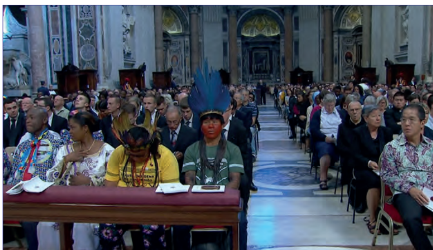
Die Veranstaltungen im Umfeld der Synode gaben naturgemäß ein deutlich bunteres und gemischteres Bild als die eigentliche Versammlung der Bischöfe ab

Den auch von Kardinal Christoph Schönborn erhobenen Vorwurf, die Synode sei von Bischöfen instrumen-