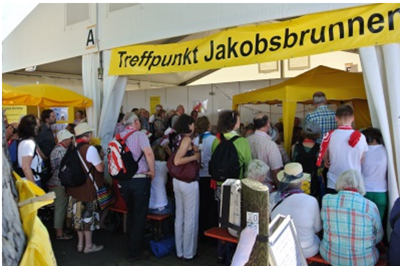
Wir sind Kirche -Zelt beim Kirchentag 2015 in Stuttgart Öffnungszeiten „Markt der Möglichkeiten“

Wir sind Kirche wird wieder auf dem „Markt der Möglichkeiten“ im Bereich Ökumene mit den stündlichen „Gesprächen am Jakobsbrunnen“ dabei sein, die seit mehr als 25 Jahren zu unserem Markenzeichen auf Katholiken- und Kirchentagen geworden sind.