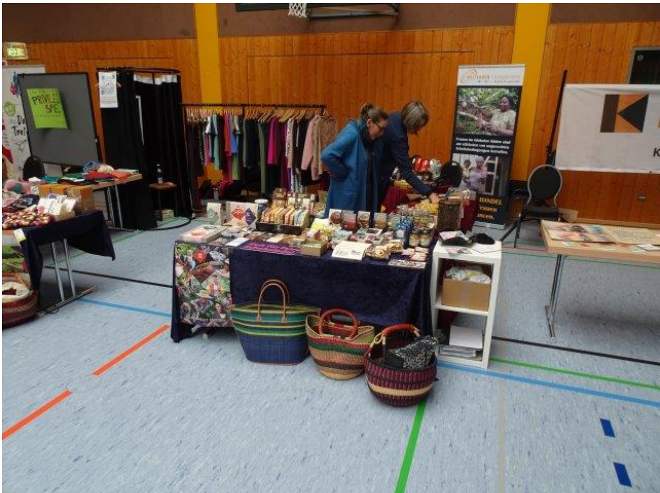
Der Weltladen Remagen-Sinzig