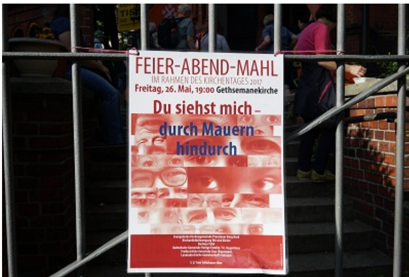
Plakat für das Feier-Abend-Mahl (Dieter Wendland)