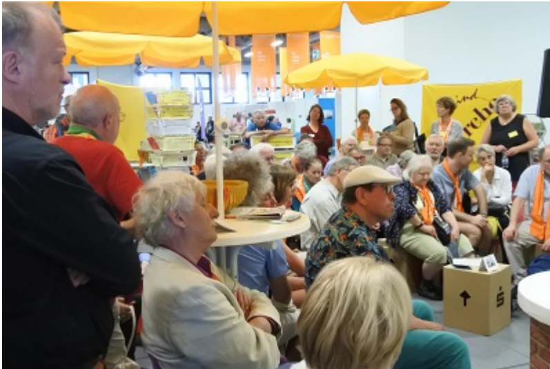
Immer wieder großes Interesse an unseren "Gesprächen am Jakobsbrunnen"