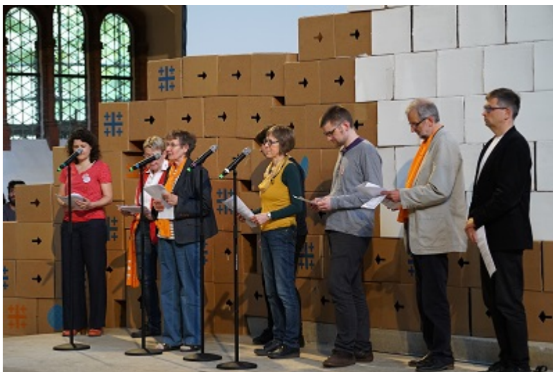
Die mitwirkenden Gemeinden und Gruppen stellen sich vor