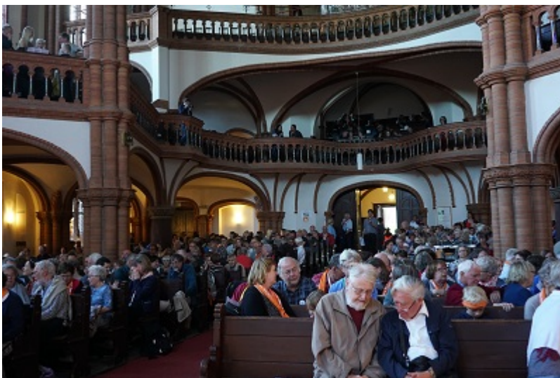
Murmelgruppen über die Bibelstelle Joh 20, 19-22