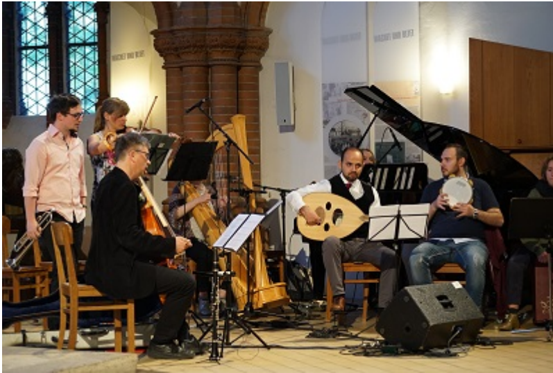
Die deutsch-syrische Musikgruppe Habibi spielt auf