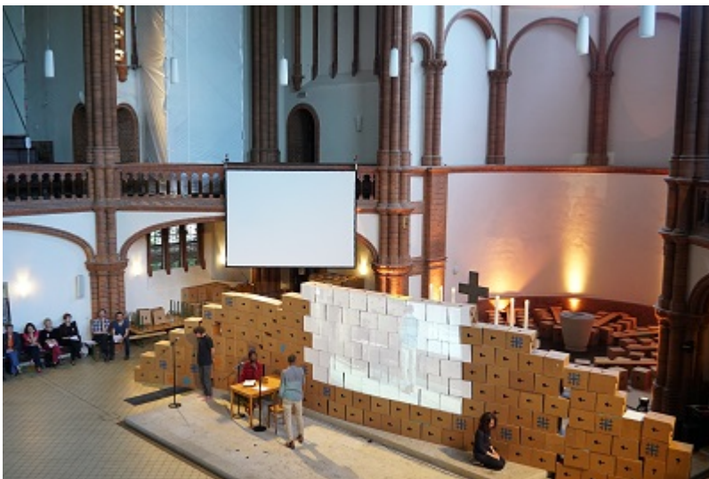
Theatereinspiel "Mauern/Grenzen" durch die Theatergruppe "One day today"