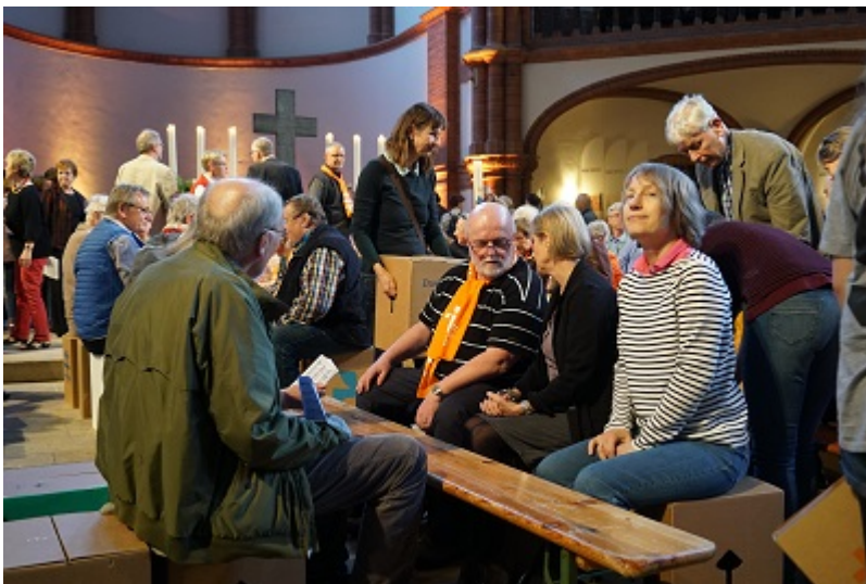
... und zu Sitzgruppen für die Tischgemeinschaften "verwandelt"