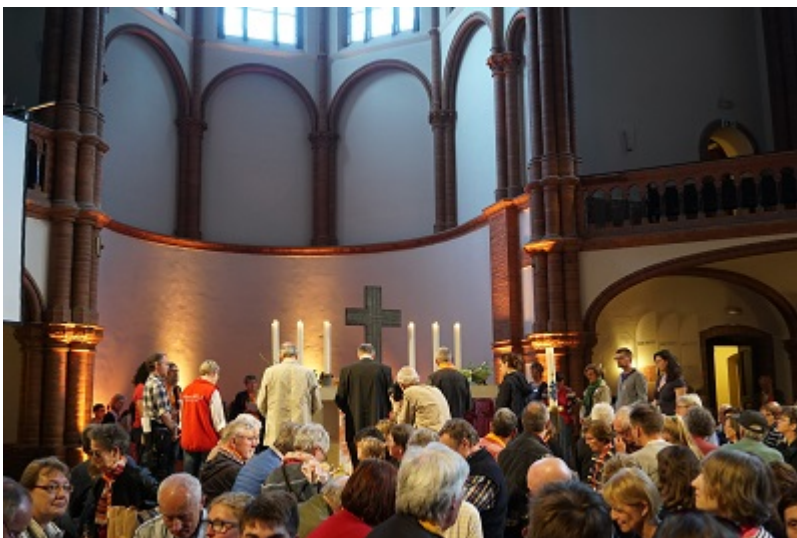
Segnung der Brote und Speisen und des Wassers am Altar