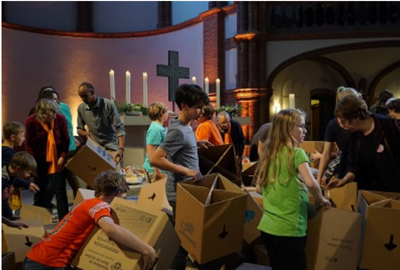
Die Mauer (aus Kirchentagshockern) wird abgebaut ...