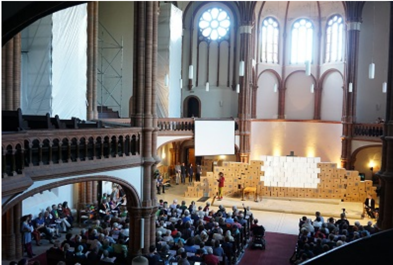
Theatereinspiel "Mauern/Grenzen" durch die Theatergruppe "One day today"