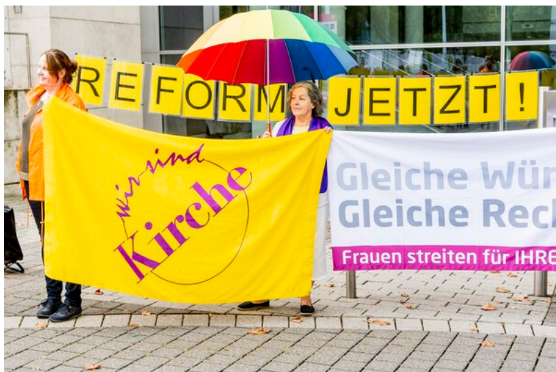
Synodaler Weg / Maximilian von Lachner

Donnerstag, 8. September 2022: Sprachlos!