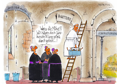
Renovierungsbedarf im Hause Gottes