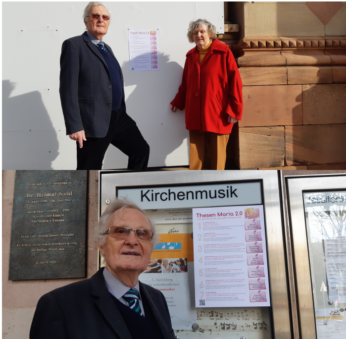
Dom zu Speyer