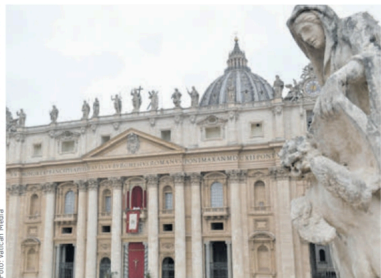
Die Bewegung „Wir sind Kirche“, die aus einem Kirchenvolksbegehren hervorging, setzt sich für eine Erneuerung der katholischen Kirche ein. Der Petersdom im Vatikan, als Herzstück der katholischen Kirche, steht dabei symbolisch für den Ort, an dem diese Reformen angestrebt werden sollen.