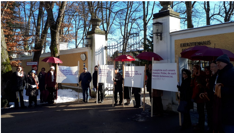
Mahnwache von 11 bis fünf vor 12 vor dem Eingang zum Exerzitienhaus Fürstenried ...

Pressefotos in größerer Auflösung bei presse@wir-sind-kirche.de anforderbar