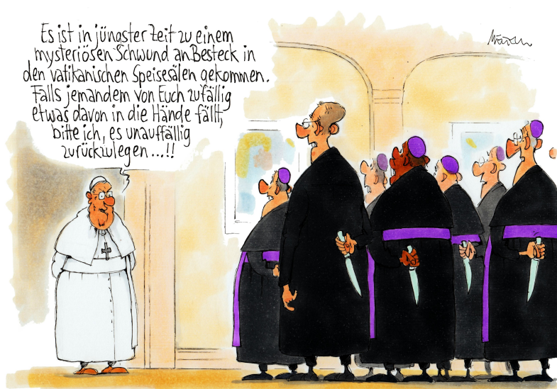
Karikatur © Gerhard Mester