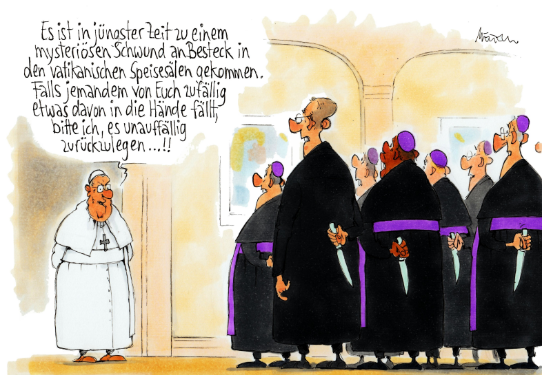
Karikatur © Gerhard Mester