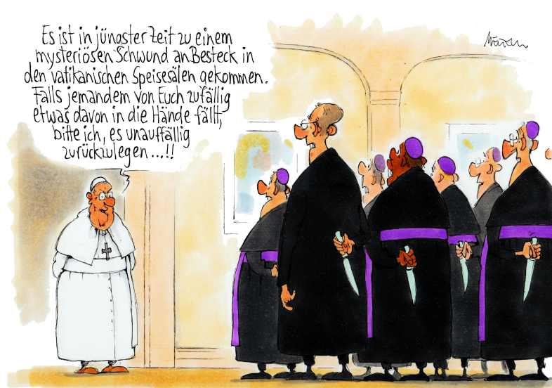
Karikatur © Gerhard Mester