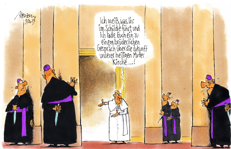
Karikatur © Gerhard Mester