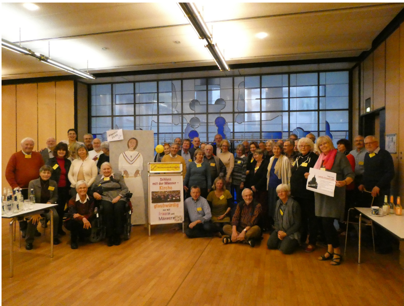
Ein Teil der über 80 Teilnehmenden beim Gruppenfoto