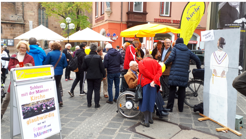
Straßenaktion "Schluss mit der Männerkirche" in der Fußgängerzone vor dem CPH