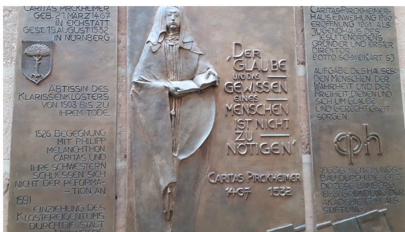
Caritas Pirckheimer (1467-1532): "Der Glaube und das Gewissen eines Menschen ist nicht zu nötigen"