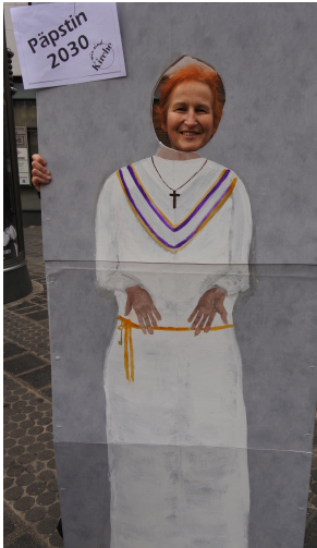
Von vielen genutzte Foto-Wand "Päpstin 2030"