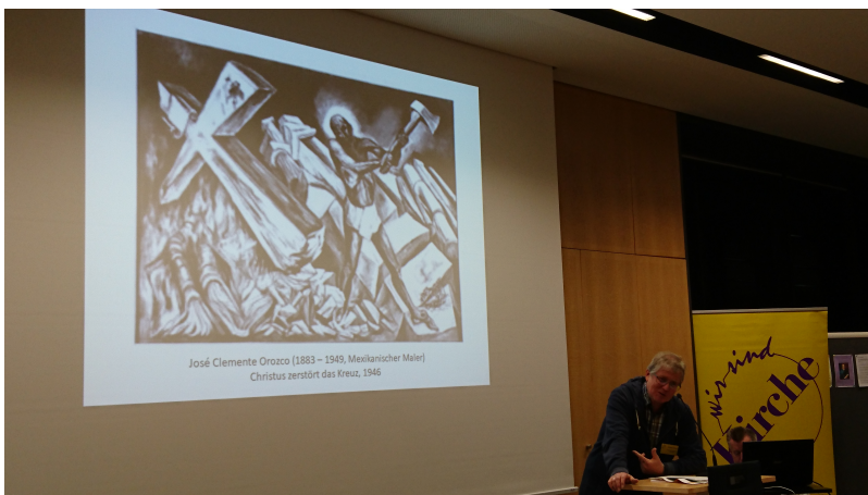
Einführung in die Friedenthematik durch Günther Doliwa ...