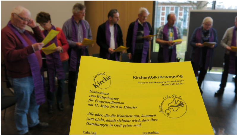
Gottesdienst zum Weltgebetstag für Frauenordination