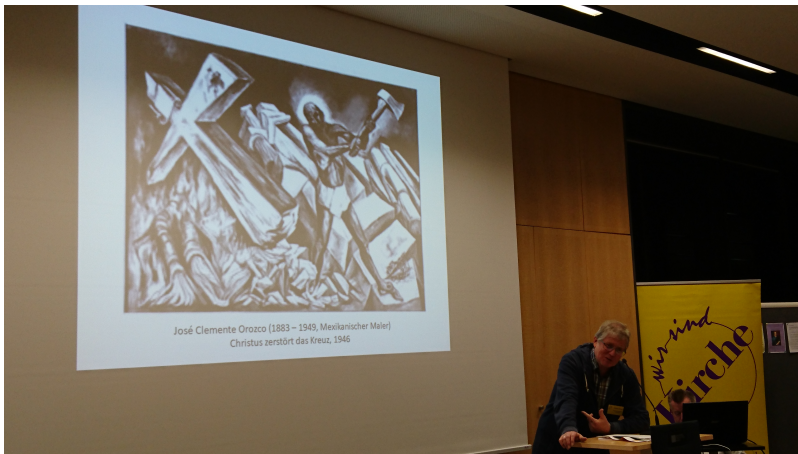
Einführung in die Friedenthematik durch Günther Doliwa ...