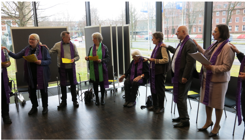
Wegen des schlechten Wetters diesmal im Franz Hitze Haus