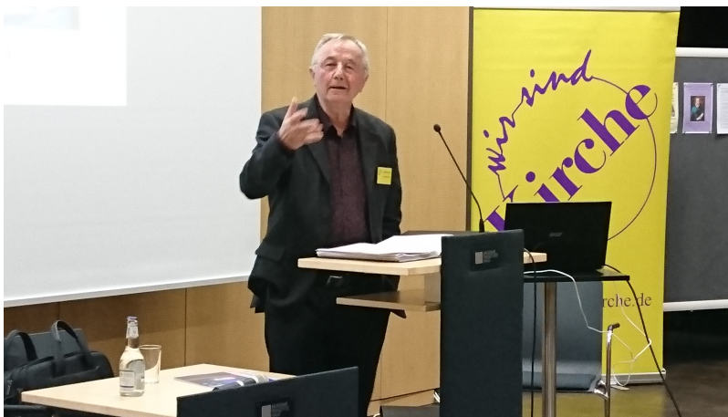
... und durch Norbert Arntz vom ITP