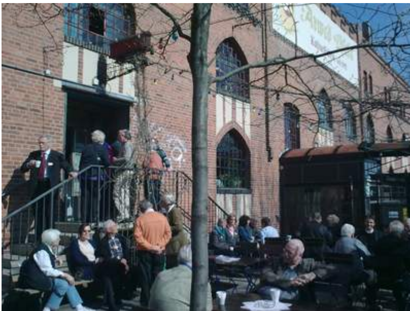
Pausengespräche im Tagungsort "KulturFabrik Hildesheim", in der Wir sind Kirche schon 1996 den KirchenVolksTag mit Gaillot gefeiert hat.