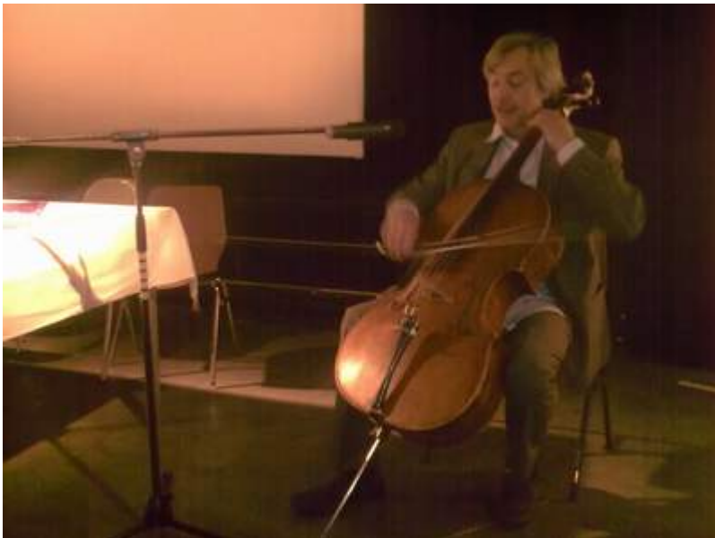
Musikalische und textliche Begleitung durch Ulrich Thiem aus Dresden www.bachundbluesdresden.de