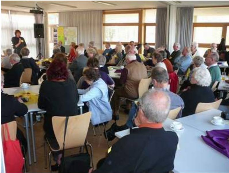
Plenum der Bundesversammlung in der Jugendbildungsstätte Unterfranken

In einer anschließenden „Schreibwerkstatt“ stellten die mehr als 100 Delegierte und Gäste konkrete Handlungsmöglichkeiten für die KirchenVolksBewegung zusammen.