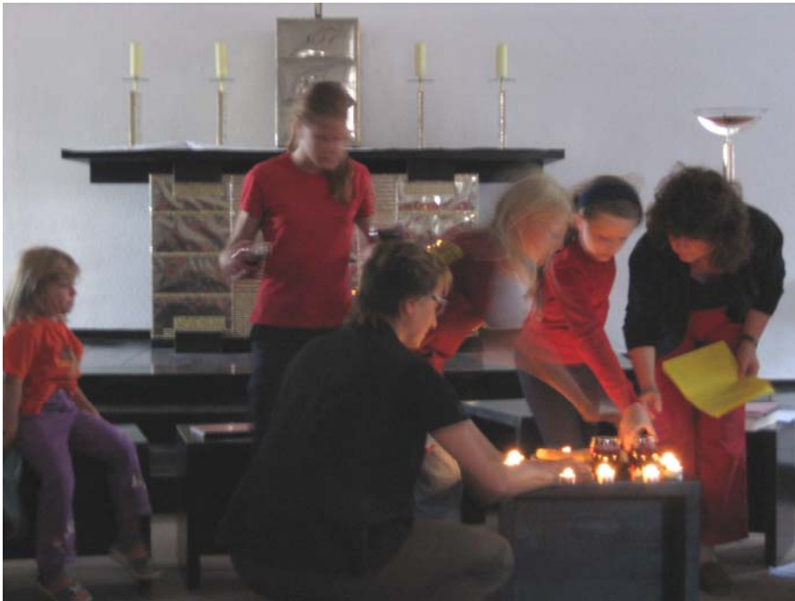
Spirituelle Begegnungstage auf Burg Rothenfels

Die zentrale frohe Botschaft des Jesus von Nazaret ist die vom liebenden Gott, der dem verlorenen Schaf nachgeht, den verlorenen Sohn umarmt und ihm ein Festmahl ausrichtet. Jesus hat sich vor allem um die am Rande Stehenden gekümmert. „Der akzeptiert ja sündige Leute und isst mit ihnen!“, kritisieren ihn die Pharisäer (Lk 15,2). Er selbst mahnt: „Richtet niemand, dann wird Gott auch euch nicht richten. Verurteilt niemand, dann wird Gott auch euch nicht verurteilen. Verzeiht, dann wird euch Gott verzeihen.“ (Lk 6,37)