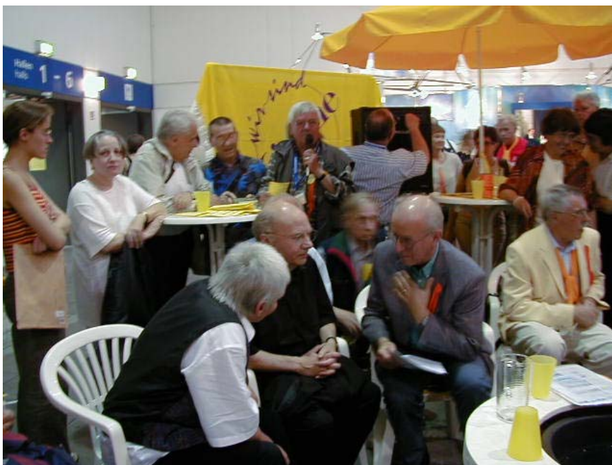
Bischof Jacques Gaillot beim „Gespräch am Jakobsbrunnen

Die KirchenVolksBewegung beteiligt sich an allen Katholiken- und Kirchentagen mit Veranstaltungen, Gottesdiensten, Informationsständen und den schon traditionellen „Gesprächen am Jakobsbrunnen“. Gerade auch bei den Katholikentagen wird immer wieder die große Zustimmung praktizierender Katholiken und Katholikinnen zu den von der KirchenVolksBewegung vertretenen Reformanliegen spürbar.