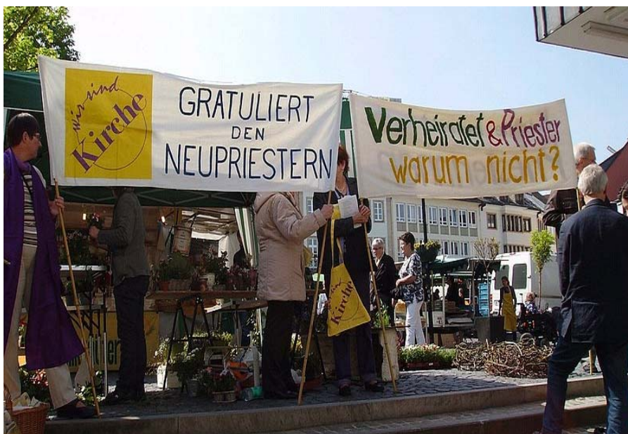
Mahnwache bei der Bischöflichen Konferenz 2011 in Paderborn

In Deutschland wie in der gesamten katholischen Kirche steht die Seelsorge an einem entscheidenden Wendepunkt . Immer weniger junge Männer wollen sich für den Priesterberuf entscheiden, der ihnen eine zölibatäre Lebensweise auferlegt. Auch die Orden sprechen von dramatischem Nachwuchsmangel.