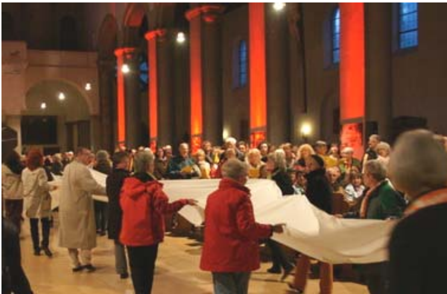
Gedächtnismahl in der St. Maximilian-Kirche beim Ökumenischen Kirchentag 2010 in München

Wenn eine/r alleine träumt, ist es nur ein Traum. Wenn viele gemeinsam träumen, dann ist das der Beginn einer neuen Wirklichkeit. Dom Helder Camara