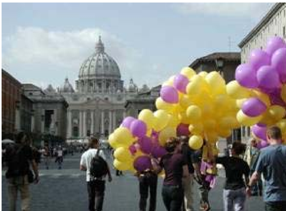
Abschluss der internationalen Kirchenvolks-Synode 2001 in Rom

Die 1996 in Rom gegründete Internationale Bewegung Wir sind Kirche ist derzeit in mehr als zwanzig Ländern auf allen Kontinenten vertreten und weltweit mit gleichgesinnten Reformgruppen vernetzt . Durch Schattensynoden, Veranstaltungen und Stellungnahmen hat Wir sind Kirche die Bischofssynoden in Rom, das letzte Konklave und andere wichtige Ereignisse begleitet.