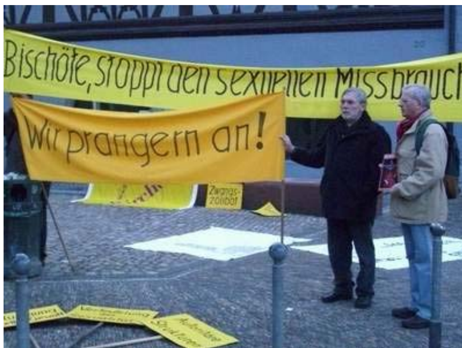
Wir sind Kirche- Mahnwache bei der Bischofskonferenz 2010 in Freiburg

Angesichts der 2001 in Deutschland bekannt gewordenen sexualisierten Gewalt von Priestern und Ordensleuten formulierte Wir sind Kirche einen präzisen Forderungskatalog an die deutschen Bischöfe. Zwischen 2002 und 2011 hat Wir sind Kirche ein Not-Telefon betrieben, mit dem mehr als 400 Menschen beraten und begleitet wurden, die Opfer sexueller Gewalt durch Priester und Ordensleute sind.