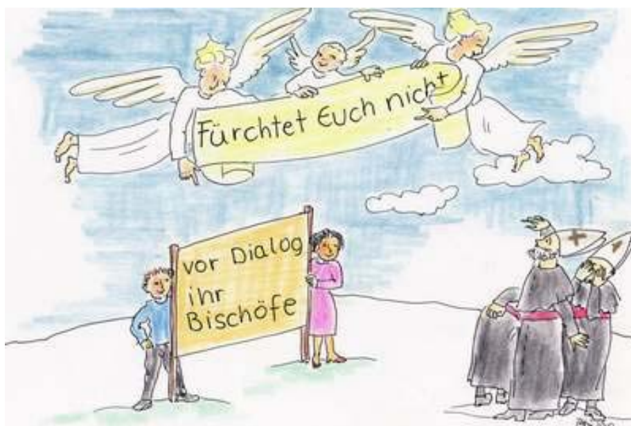
Karikatur von Annelie Hürter

Gemäß der Konzils-Konstitution über die Kirche („Lumen Gentium“ Art. 37) und Canon 212 § 3 des Kirchenrechts haben die Gläubigen „das Recht und bisweilen sogar die Pflicht, ihre Meinung in dem, was das Wohl der Kirche angeht, den geistlichen Hirten mitzuteilen und sie unter Wahrung der Unversehrtheit des Glaubens und der Sitten und der Ehrfurcht gegenüber den Hirten und unter Beachtung des allgemeinen Nutzens und der Würde der Personen den übrigen Gläubigen kundzutun.“