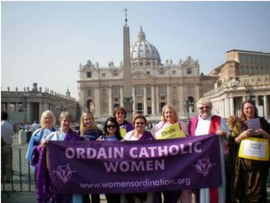
Internationale Aktion zur Frauenordination 2008 in Rom

Entscheidende Mitsprache und volle Mitentscheidung in allen kirchlichen Gremien ist in unserer Kirche z.Zt. nur über das Amt zu erreichen. Darum ist es notwendig, Frauen zum diakonalen und priesterlichen Amt zuzulassen und die Berufungen vieler Frauen zu diesen Ämtern anzuerkennen.