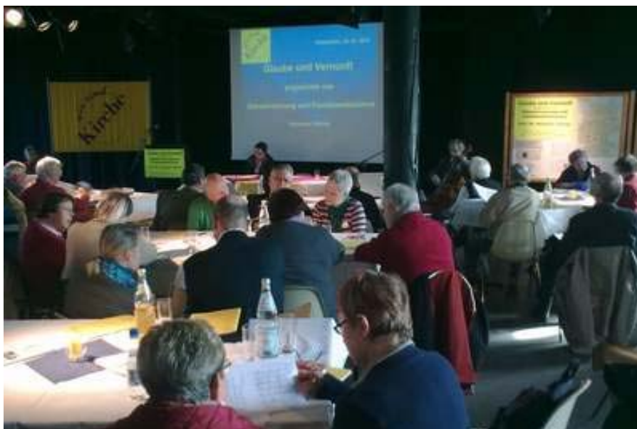
Wir sind Kirche-Bundesversammlung im Frühjahr 2012 in Hildesheim

* Textdokumentation vorhanden und bestellbar