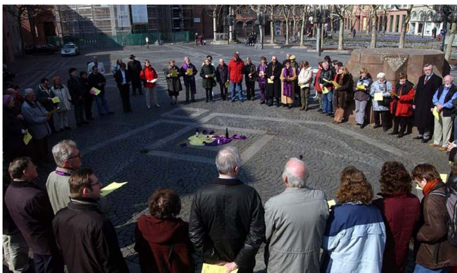
Wir sind Kirche- Gottesdienst vor dem Mainzer Dom im Frühjahr 2004

Die frühe Kirche war keine Zwei-Stände-Kirche. Petrus spricht vom „königlichen Priestertum“ aller Gläubigen (1 Petr 2,5). Alle sollen mit ihren Begabungen und Charismen der Gemeinde dienen und sich „gegenseitig ermahnen“ (Röm 15,14).