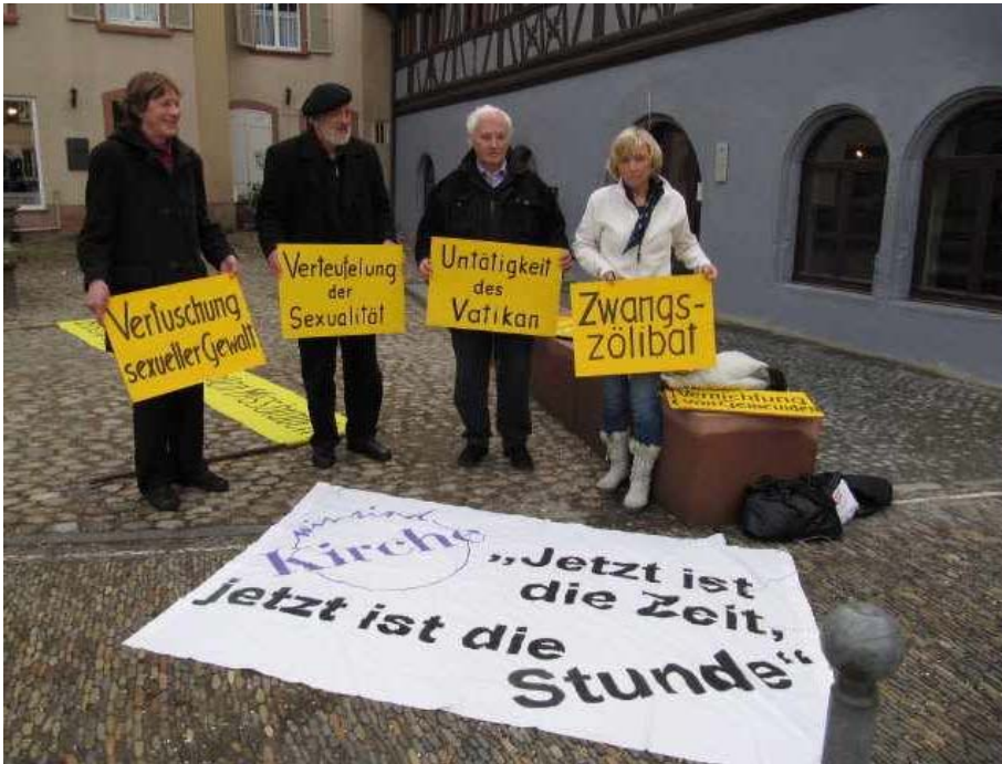
Wir sind Kirche- Mahnwache bei der Bischofs-konferenz 2010 in Freiburg

Die KirchenVolksBewegung setzt sich ein für eine positive Bewertung der Sexualität als Teil des von Gott geschaffenen und bejahten Menschen und für die Anerkennung der verantworteten Gewissensentscheidung auch in Fragen der Sexualmoral.