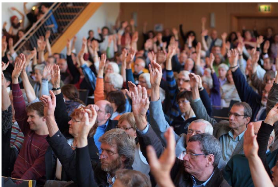
Abschlussplenum der Konziliaren Versammlung am 21. Oktober 2012 in Frankfurt am Main

Am 11. Oktober 2012 jährte sich der Beginn des Zweiten Vatikanischen Konzils zum 50. Mal. Aus diesem Anlass haben kirchliche und gesellschaftliche Reformgruppen die Konziliare Versammlung „Zeichen der Zeit – Hoffnung und Widerstand“ veranstaltet. Wir sind Kirche war von Anfang an an der Planung und Durchführung beteiligt. Wegen der Mitgestaltung hat es keine eigene Wir sind Kirche -Bundesversammlung im Herbst 2012 gegeben.